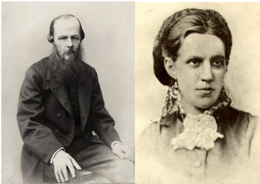
Федор Михайлович Достоевский и Анна Григорьевна Достоевская