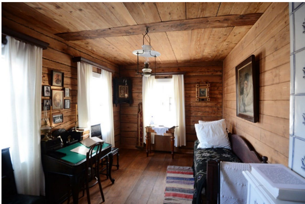
Келья старца Амвросия Оптинского