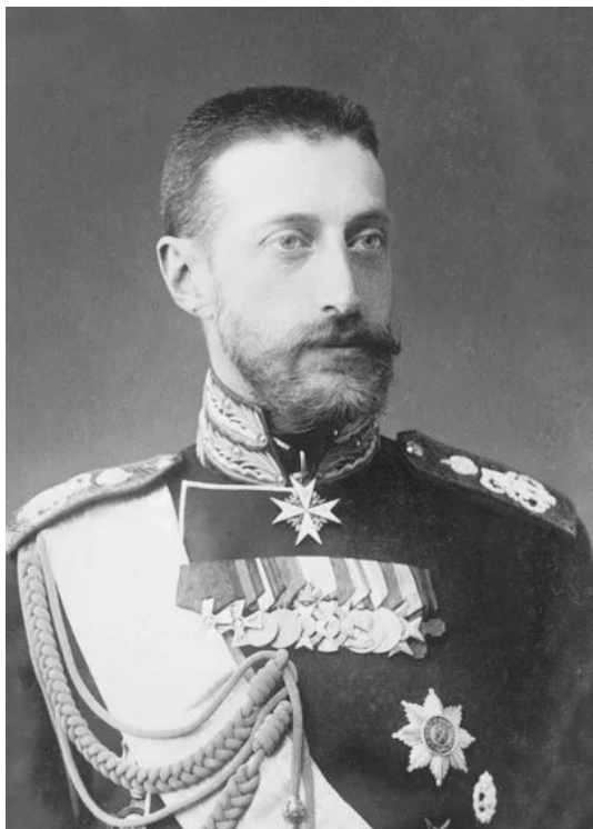
Великий князь Константин Константинович Романов