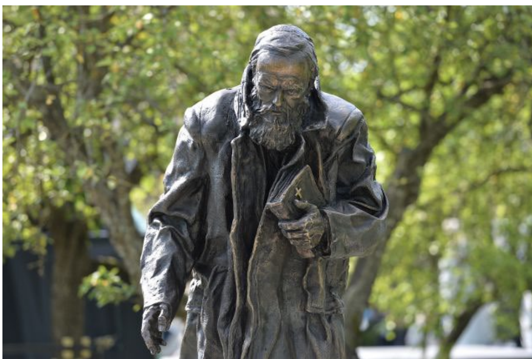
Памятник Ф. М. Достоевскому в Оптиной пустыне