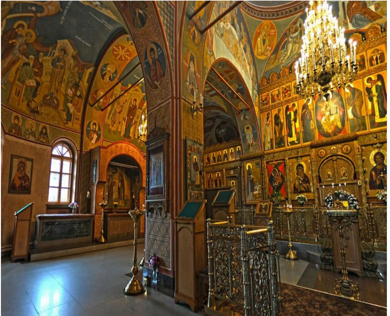
Введенский собор Оптиной пустыни. Иконостас.