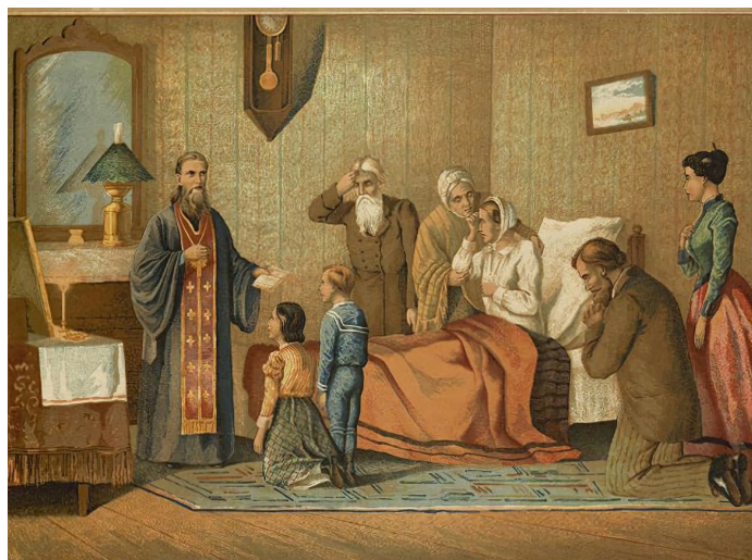
ЛИТОГРАФИЯ КОНЦА XIX ВЕКА