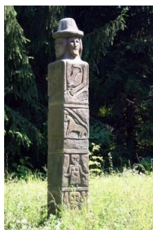
ЗБРУЧВСЬКИЙ ІДОЛ . ТЕРНОПІЛЬ, УКРАЇНА