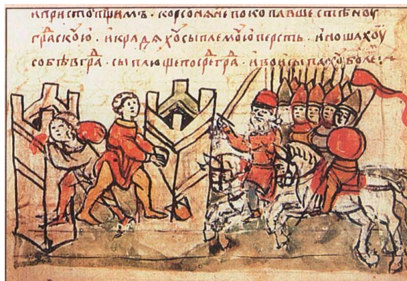
МИНИАТЮРА ИЗ РАДЗИВИЛЛОВСКОЙ ЛЕТОПИСИ