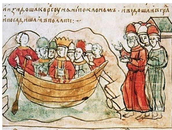
МИНИАТЮРА ИЗ РАДЗИВИЛЛОВСКОЙ ЛЕТОПИСИ