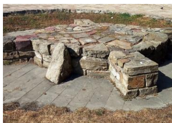
ЯЗЫЧЕСКОЕ КАПИЩЕ. РЕКОНСТРУКЦИЯ. КИЕВ