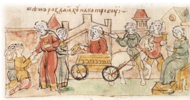
МИНИАТЮРА РАДЗИВИЛОВСКОЙ ЛЕТОПИСИ