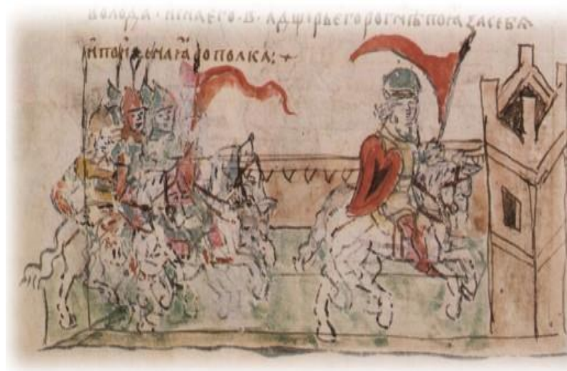
МИНИАТЮРА ИЗ РАДЗИВИЛЛОВСКОЙ ЛЕТОПИСИ