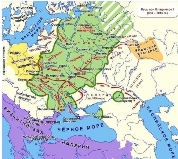
РУССКАЯ ЗЕМЛЯ К КОНЦУ ПРАВЛЕНИЯ КНЯЗЯ ВЛАДИМИРА СВЯТОСЛАВОВИЧА