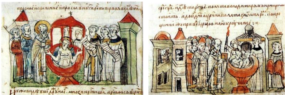
МИНИАТЮРЫ ИЗ РАДЗИВИЛЛОВСКОЙ ЛЕТОПИСИ