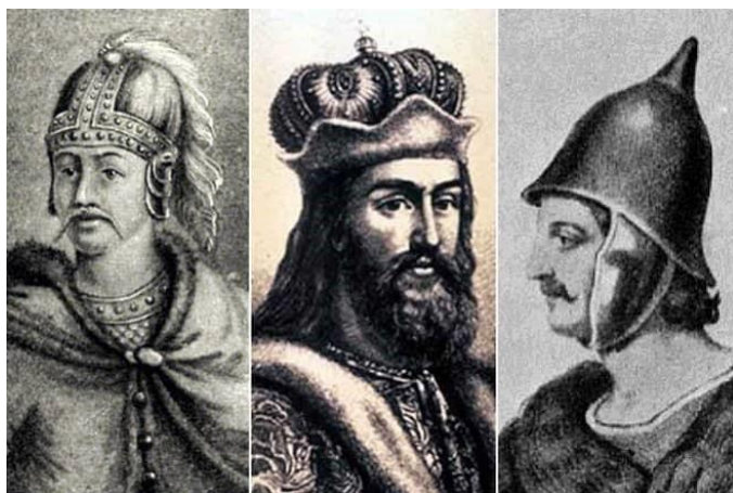
Сыновья кн. Святослава: Олег, Владимир, Ярополк . Рис. XVII- XIXвв.