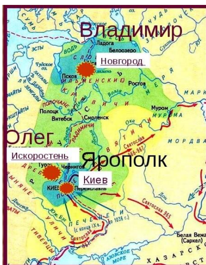
КНЯЖЕНИЕ СЫНОВЕЙ КНЯЗЯ СВЯТОСЛАВА