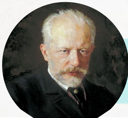
Пётр Ильич — великий русский композитор Чайковский