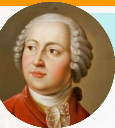
Михаил Васильевич — великий учёный Ломоносов