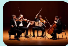
Искусство и творчество