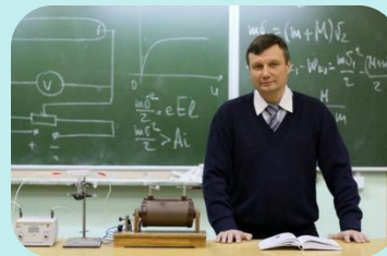
Образование и воспитание