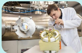
Наука и исследования