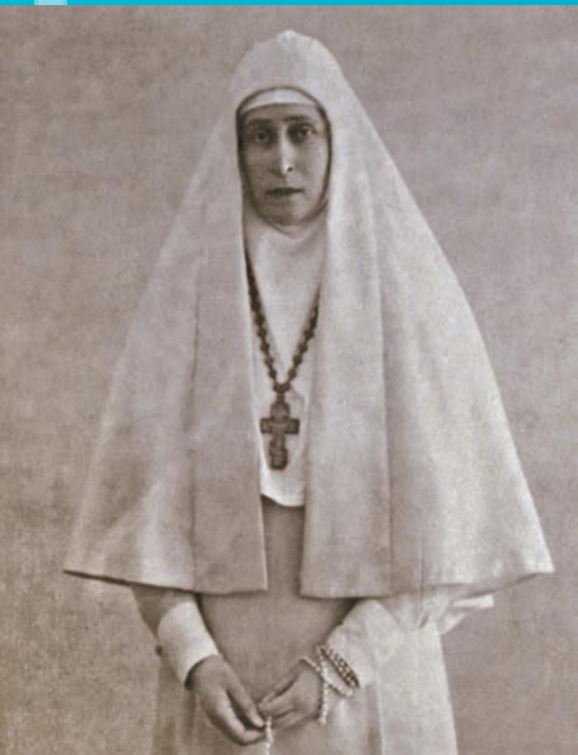
княгиня Елизавета Фёдоровна Романова

С XIX в. повсеместно стали возникать общества сестёр милосердия. Великая княгиня Елизавета Фёдоровна Романова, сестра императрицы, основала Марфо-Мариинскую обитель милосердия