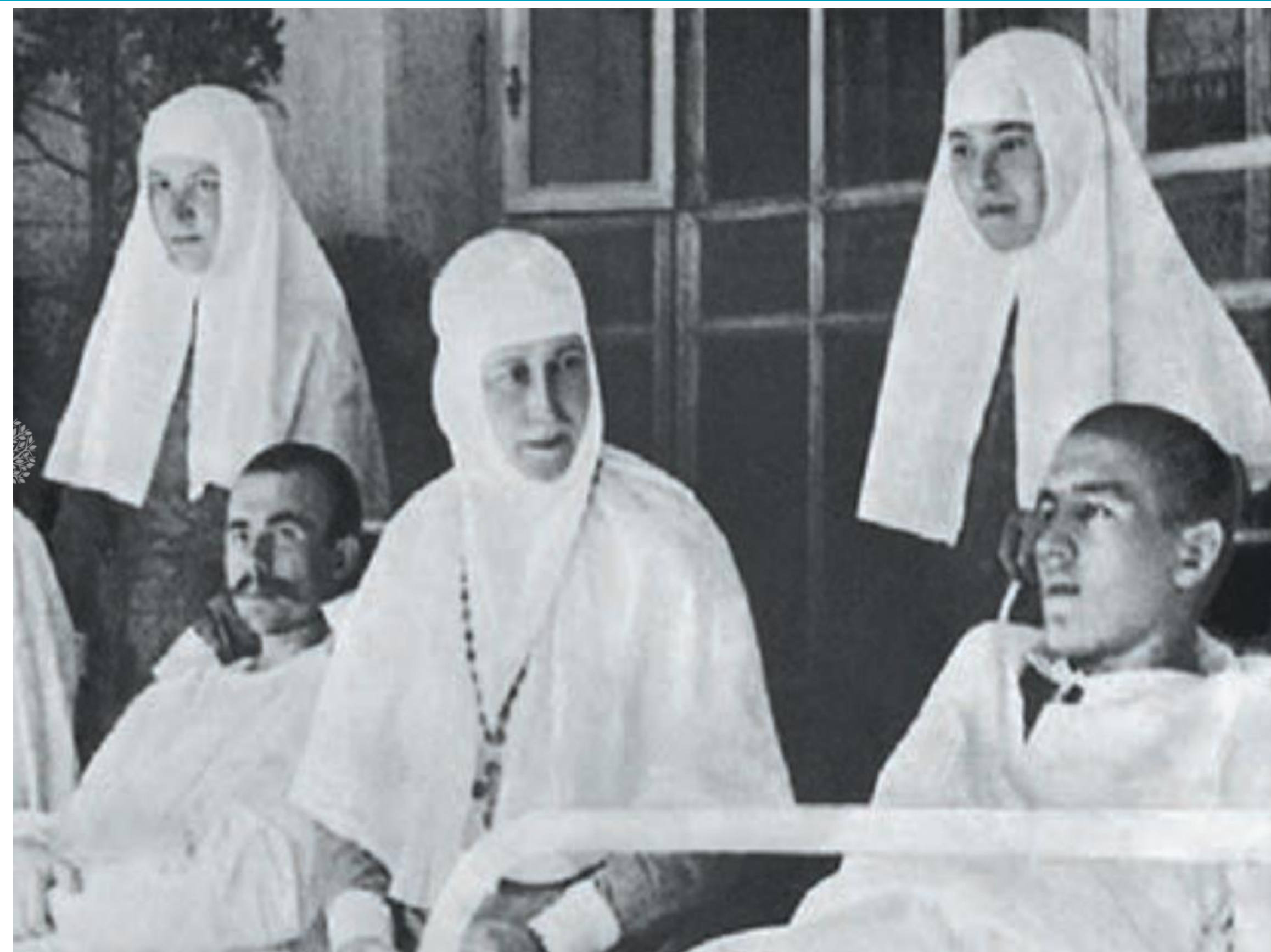
Великая княгиня Елизавета Фёдоровна ухаживает за ранеными солдатами. Москва, 1915 г.

Милосердие — это традиционная российская духовно-нравственная ценность: доброжелательное, заботливое отношение к другому, которое проявляется в сострадании, человеколюбии, готовности оказать бескорыстную помощь, понять и простить кого-либо, что-либо.