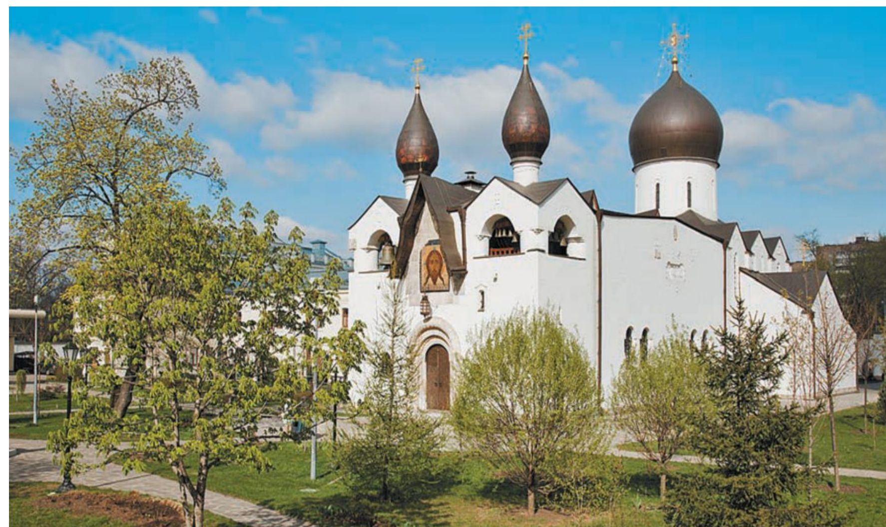
Марфо-Мариинская обитель милосердия.

С XIX в. повсеместно стали возникать общества сестёр милосердия. Великая княгиня Елизавета Фёдоровна Романова, сестра императрицы, основала Марфо-Мариинскую обитель милосердия